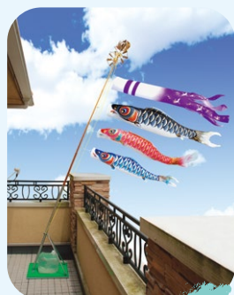
お手軽なスタンドセットも人気

風をいっぱいはらみ泳ぐ鯉のぼり。天高く揚げられた鯉のぼりは我が家に無事子供が生まれたことを神様に知らせる目印。我が子の健やかな成長を願うこの国の人々の営みの歴史が空を泳ぐ鯉のぼりに込められています。